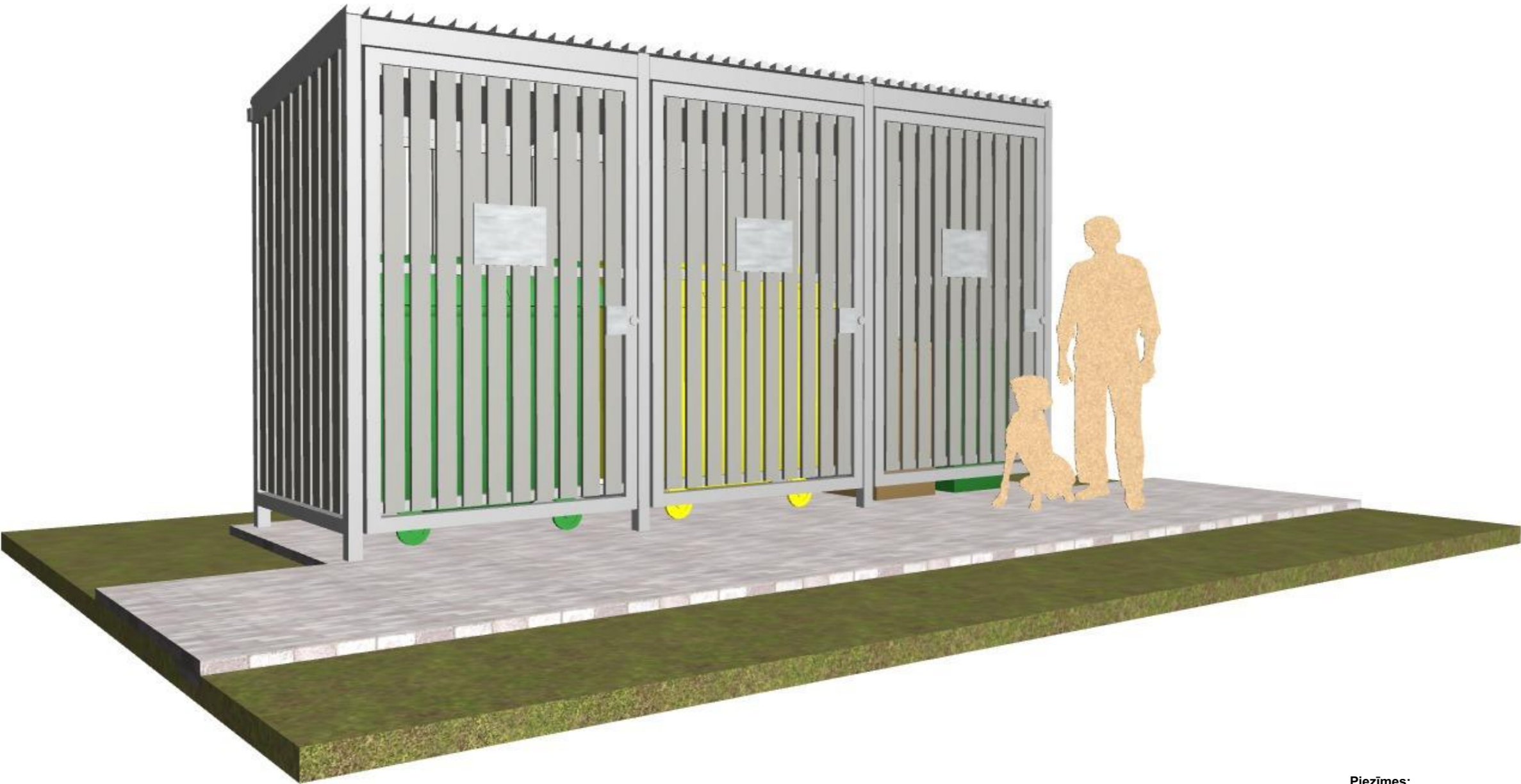
Krāsu pase, variants Nr. 1 - gaiši pelēks